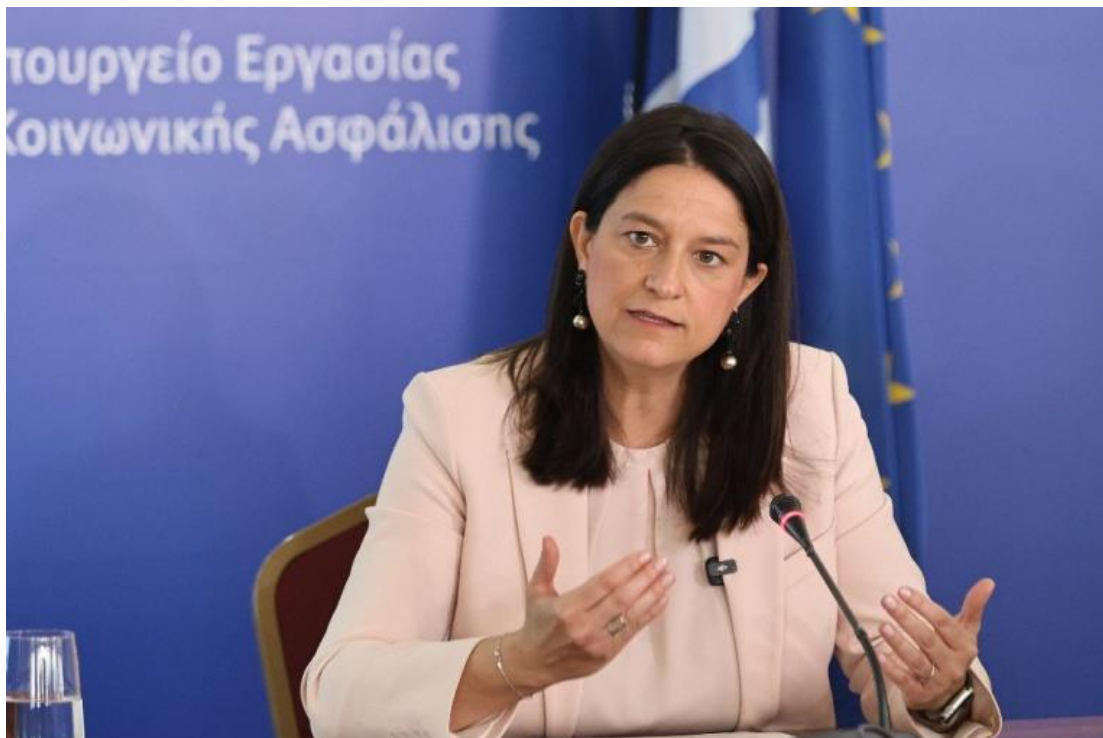
Η υπουργός Εργασίας και Κοινωνικής Ασφάλισης, Νίκη Κεραμέως.

Όπως αναφέρουν στο inside story πηγές του υπουργείου Εργασίας: «Η χώρα μας διαθέτει ένα σύγχρονο ασφαλιστικό σύστημα, αποτέλεσμα μιας ιδιαίτερα δύσκολης ασφαλιστικής μεταρρύθμισης», αλλά και των μέτρων των κυβερνήσεων της ΝΔ «για περαιτέρω ενίσχυση της βιωσιμότητάς του και ανάκτησης της εμπιστοσύνης των ασφαλισμένων».